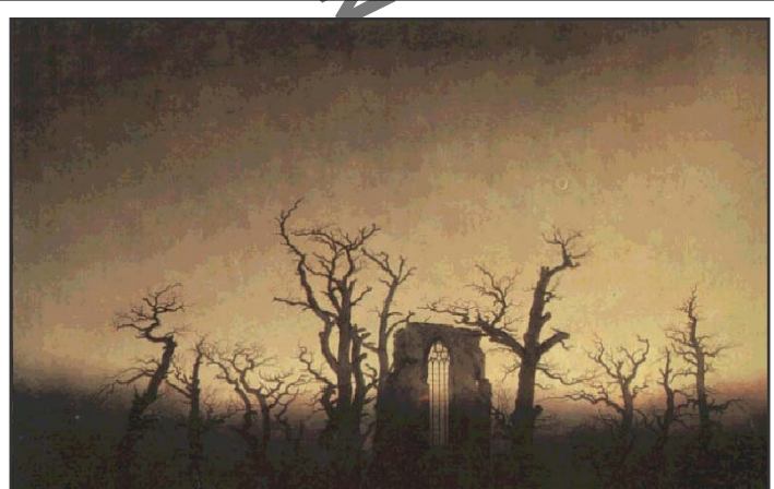
Caspar David Friedrich „Opactwo w Oak Forest”

Francisco de Goya y Lucientes, znany szerzej po prostu jako Francisco Goya. W roku 1797 namalował „Odpust na łące św. Izydora”, a w latach 1814-1815, czyli ciągle jeszcze przed romantyczną rewolucją, stworzył „3 maja 1808”. Niemiec Caspar David Friedrich (1774 – 1840) tworzył głównie dzieła o charakterze metafizycznym, wyrażające romantyczną tęsknotę i smutek. Wyrażał to głównie poprzez piękne pejzaże takie, jak „Krzyż w górach”, „Cmentarz klasztorny w śniegu” czy „Opactwo w Oak Forest”. Francuskim przedstawicielem romantycznego malarstwa był Eugène Delacroix. Jego