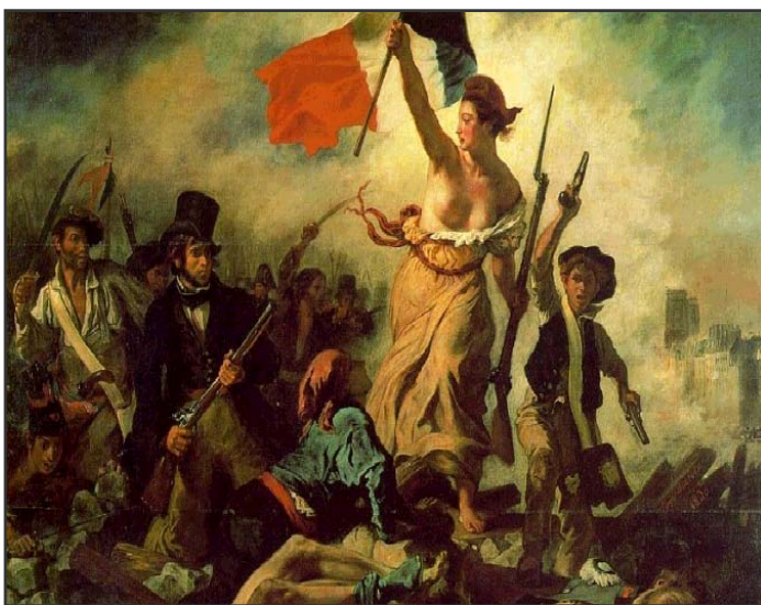
Eugène Delacroix „Wolność wiodąca lud na barykady” 1830 r.

Piotr Orłowski. Malował portrety własnej rodziny („Portret córki na koniu”) oraz studiował głowy wieśniaków („Seńko”) i Żydów, jednak na szczególne wyróżnienie w jego twórczości zasługuje seria obrazów przedstawiająca wojny napoleońskie (np. „Bitwa pod Samosierrą”). Michałowski słynął także ze świetnych studiów konia.