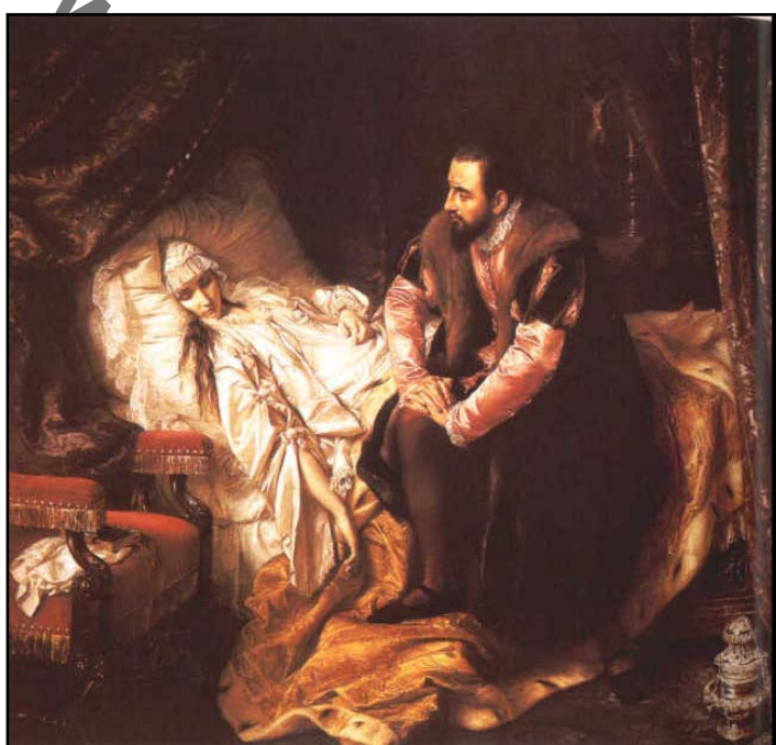
Józef Stimmler „Śmierć Barbary Radziwiłłówny” 1860 r.

W drugiej ćwierci XIX w. wielką popularność zyskali malarze nawiązujący do gotyku, sztuki renesansowej,