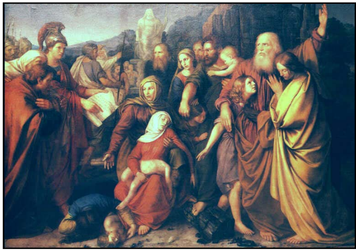
Wojciech Korneli Stattler „Machabeusze” 1844 r.

Innym polskim malarzem był Aleksander Orłowski. Malował bitwy, sceny rodzajowe, zabawy w karczmach, targi i zaprzęgi – jednym słowem przeciwstawiał się klasycznym treściom. Odbieganie od statycznych form widać w jego sposobie malowania – swobodne kreski, barwne plamy. Przykładem jego obrazu jest „Krajobraz z wiatrakami”.