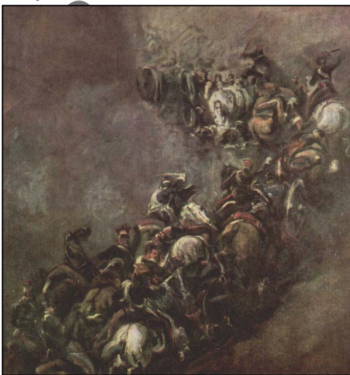
Piotr Michałowski „Bitwa pod Samosierrą” ok. 1837 r.